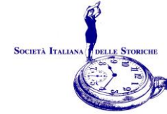
Illustrazione di copertina: Pat Carra

Contatti: segreteria@societadellestoriche.it presidenza.sis@gmail.com